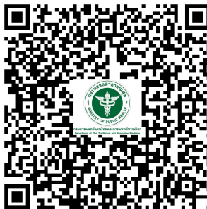
รายงานผลการดำเนินการปิดประกาศโฆษณาฯ

เมื่อท่านได้ดำเนินการปิดประกาศโฆษณาฯ ดังกล่าวข้างต้นแล้วนั้น ขอความอนุเคราะห์ท่านรายงาน ผลการดำเนินการปิดประกาศโฆษณาฯ ใน Google Form ที่แนบมาพร้อมนี้ ต่อไปด้วย จะเป็นพระคุณ