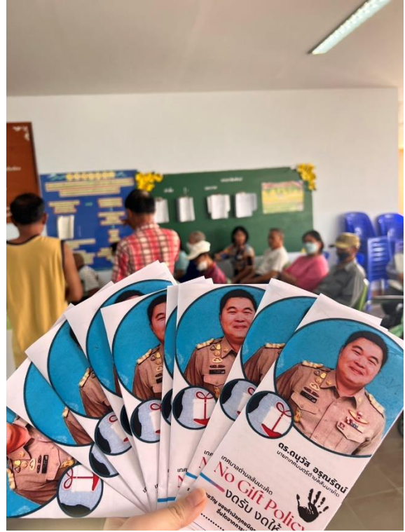
ตัวอย่างรูปแบบแผ่นพับ